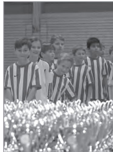
Gespannt blicken die kleinen Kicker auf die Pokale