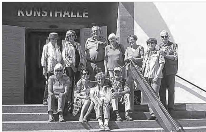
Kulturgebeisterte Seeshaupter